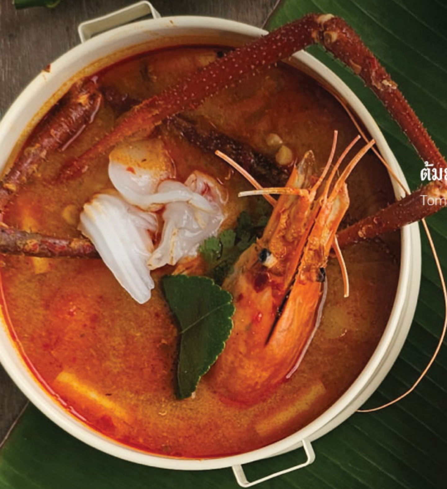
ต้มยำกุ้งแม่น้ำมะพร้าวอ่อน Tom Yum River Prawn with Young Coconut