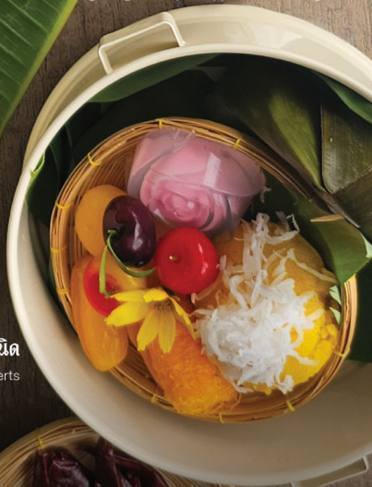
ขนมไทย 5 ชนิด A Variety of Thai Desserts