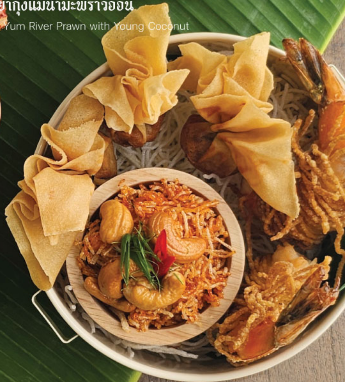
หมี่กรอบ, ถุงทอง, กุ้งพันโสร่ง Crispy Noodles, Thung Tong, Shrimp Wrapped in a Sarong